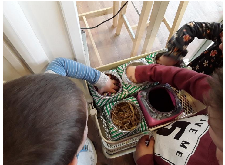
Voelen bij de Dolfijnen