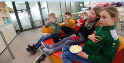
Film kijken bij de Haaien

Daar komen eens 2 spinnetjes aan, kriebelkrabbelkriebelkrabbel kriebel krab. De ene heet Piet en de andere heette Jan, kriebelkrabbelkriebelkrabbel kriebel krab. Fft, weg is Piet, Fft weg is Jan. Daar komen zij weer aan. Kriebelkrabbelkriebelkrabbel kriebel krab.